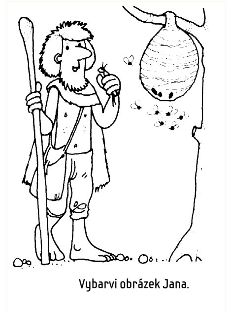
Vybarvi obrázek Jana.

Ježíš, Boží Syn, se opravdu ponížil, a to tak, že se nechal ukřižovat, aby nám mohly být odpuštěny hříchy a abychom se mohli přátelit se samotným Bohem.