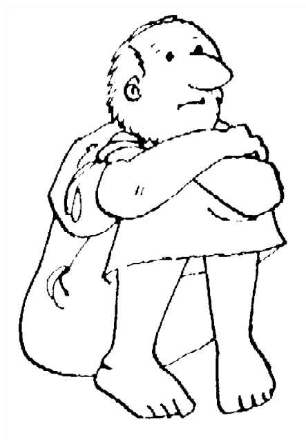
Vybarvi obrázek Jonáše

Pán však Jonášovi řekl: „Tobě je líto té rostliny a mně bylo líto Ninive, obzvláště těch sto dvaceti tisíc malých dětí.“